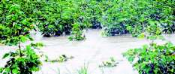
A view of a water-logged cotton field in Telangana

"We are receiving reports that about 70,000 acres of crop was damaged in the combined Warangal district alone. Cotton crop was hit in several districts. In Gadwal district, cotton was damaged extensively. In Khammam, greengram crop was hit badly. Farmers lost the crop in several villages just about the time they