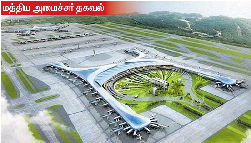
உத்தரபிரதேச மாநிலம், கிரேட்டர் நொய்டா அருகில் புதிதாக அமைக்கப்படவுள்ள ஜெவார் விமான நிலையத்தின் மாதிரி வரைபடம்.

உத்தர பிரதேச மாநில அரசின் நொய்டா சர்வதேச விமான