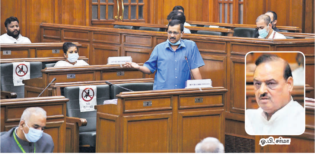
தில்லியில் வெள்ளிக்கிழமை நடைபெற்ற சட்டப்பேரவைக் கூட்டத்தில் பேசுகிறார் முதல்வர் அரவிந்த் கேஜரிவால்.